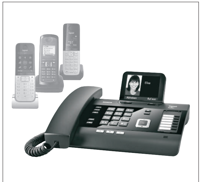
Mobilteile nicht im Lieferumfang enthalten