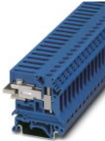
N-Trennklemme, Spezial- und Mischanschluss, Querschnitt: 0,2 mm 2 - 10 mm 2 , AWG: 24 - 8, Breite: 8,2 mm, Farbe: blau, Montageart: NS 35/7,5, NS 35/15, NS 32

Bitte beachten Sie, dass die hier angegebenen Daten dem Online-Katalog entnommen sind. Die vollständigen Informationen und Daten entnehmen Sie bitte der Anwenderdokumentation. Es gelten die Allgemeinen Nutzungsbedingungen für Internet-Downloads. ( http://download.phoenixcontact.de )