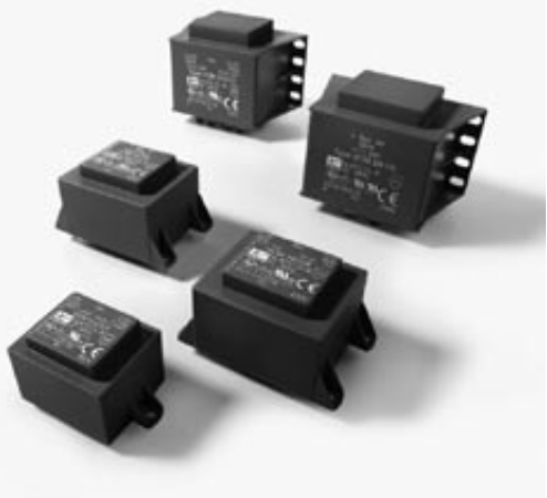
VCM 5,0/2/9, 16/2/8, 16/1/6, 50/1/6, 50/2/12