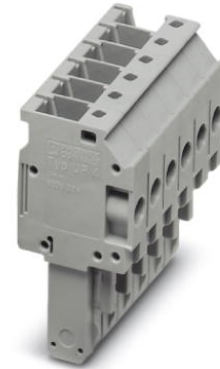
Abbildung zeigt die 6-polige Variante

http://eshop.phoenixcontact.de/phoenix/treeViewClick.do?UID=3060199