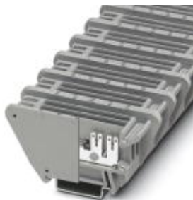
Durchgangsklemme, Anschlussart: Flachsteckanschluss, Polzahl: 1, Querschnitt: 0,5 mm 2 - 6 mm 2 , AWG: 20 - 10, Breite: 17 mm, Farbe: grau, Montageart: NS 35/7,5, NS 35/15

Bitte beachten Sie, dass die hier angegebenen Daten dem Online-Katalog entnommen sind. Die vollständigen Informationen und Daten entnehmen Sie bitte der Anwenderdokumentation. Es gelten die Allgemeinen Nutzungsbedingungen für Internet-Downloads. ( http://download.phoenixcontact.de )