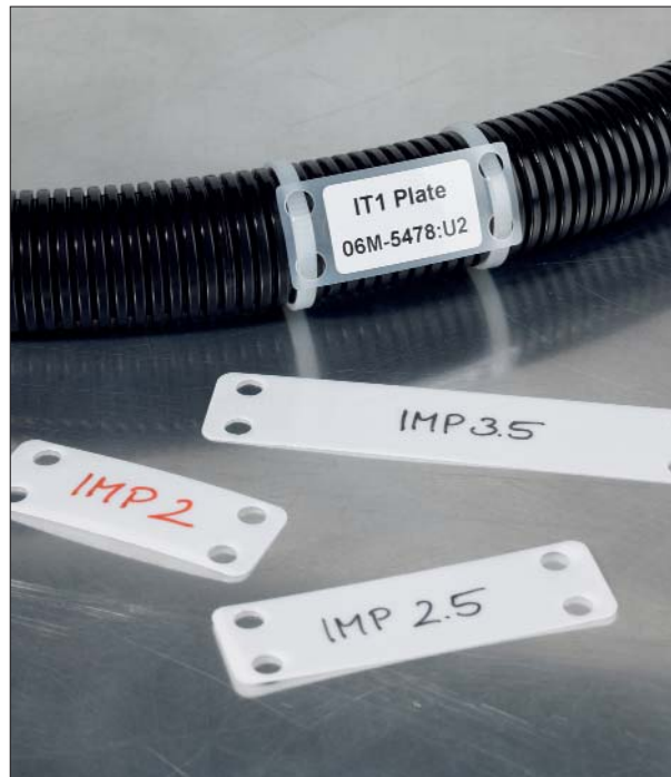
Deutliche Lesbarkeit bringt Sicherheit.

Die Kennzeichnungsplättchen eignen sich für die nachträgliche Kennzeichnung von Kabeln und Rohren. Aufgrund ihres Formates kann mehr Text untergebracht werden als auf den Schildern der Reihe AT. Die Plättchen können manuell mit den Markierstiften der Reihe T82 beschriftet oder mit passenden Etiketten versehen werden.