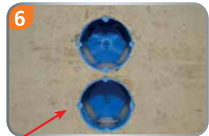
6 Hier müssen keine Rohre mehr abgeschnitten werden. Extrem hohe Zeitersparnis – absolut dicht!