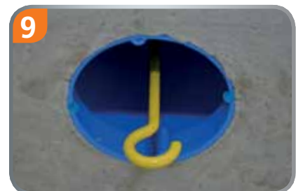
9 Montage als Deckendose, mit Klemmraum und Aufnahme für Deckenhaken.