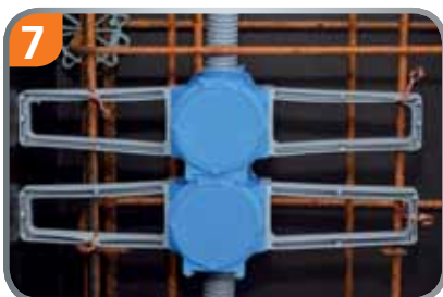
7 Montage mit Flügeln für verschiedene Betondeckungen, Flügel einfach drehen.