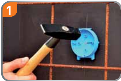
1 Gerätedeckel oder Leuchtauslassdeckel mit Nägeln auf der Schalung befestigen.