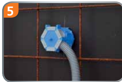
5 Fertig, absolut sichere Zugentlastung!