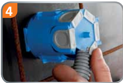
4 Rohr mit Quick-Fix-Schieber einschieben und schließen.