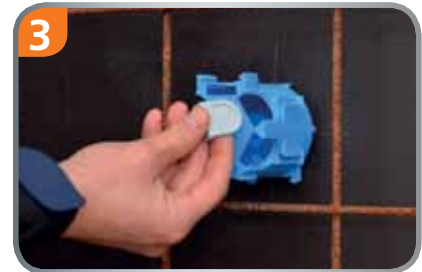
3 Nicht benötigte Öffnungen mit Schieber schließen.