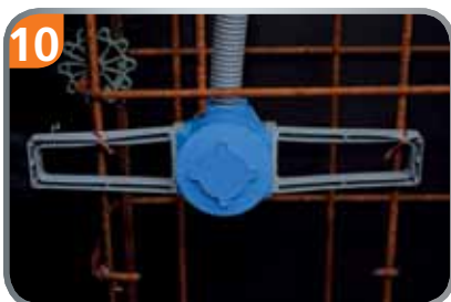
10 Auch als Leuchtauslassdose mit Auslassöffnung Ø 35 mm lieferbar.

Ideal auch zur Montage im Fertigteilwerk in Doppelwänden.