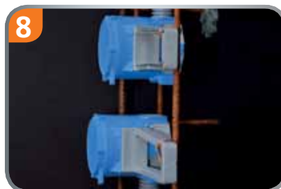
8 Für verschiedene Betondeckungen. Flügel einfach drehen.